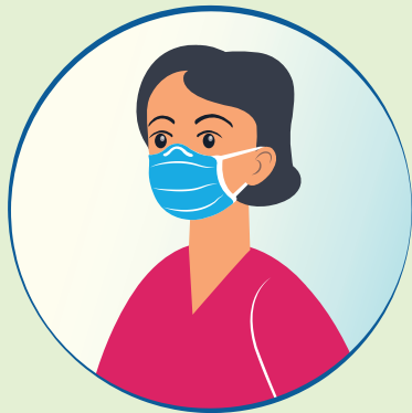
Maskenpflicht (OP- oder FFP2-Maske)

Bitte haben Sie dafür Verständnis, dass aufgrund der aktuellen Bestimmungen nur die maximale Anzahl an zulässigen Personen pro Quadratmeter den Shop betreten dürfen.